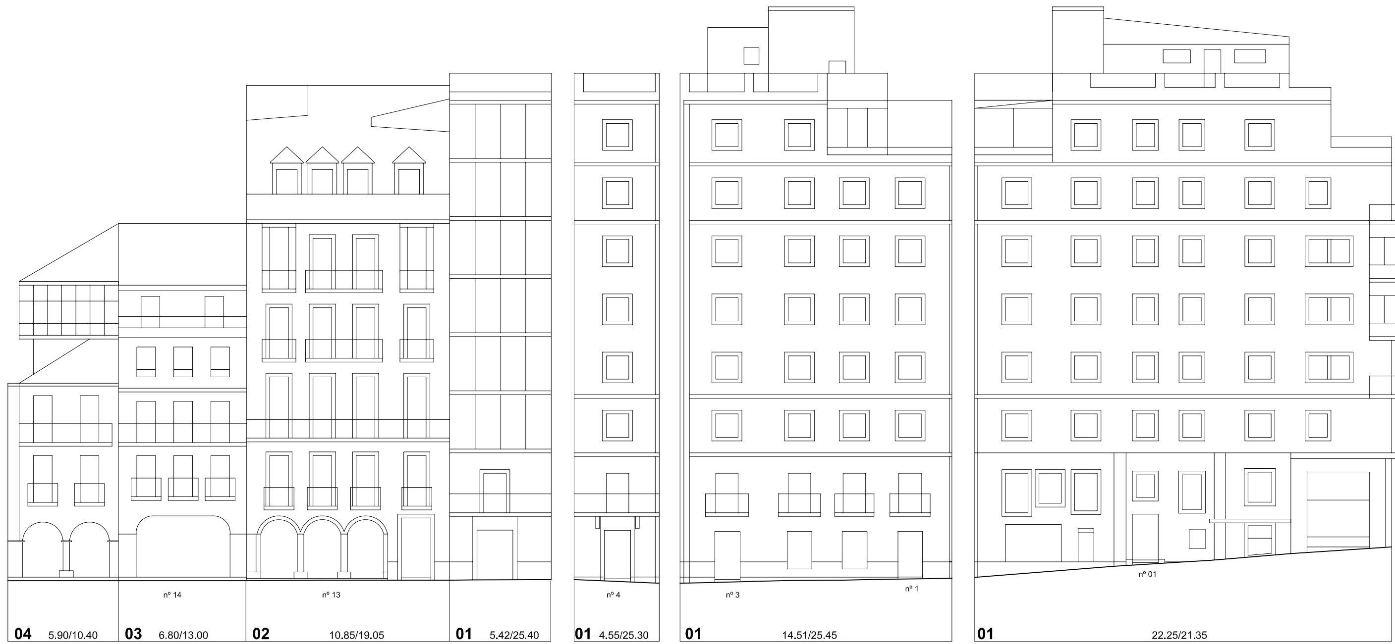
Praza da Constitución